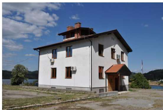
Постојећи управни објекат ЈП “Национални парк Ђердап” у Текији