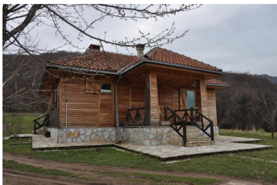
Постојећи објекат ЈП “Национални парк Ђердап” на Плочама