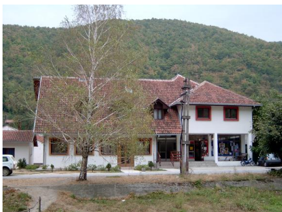
Постојећи управни објекат ЈП “Национални парк Ђердап” у Добри