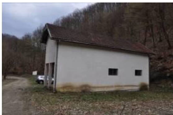
СМЕШТАЈНИ И ПОМОЋНИ ОБЈЕКАТ ЈП „НАЦИОНАЛНИ ПАРК ЂЕРДАП“ У ОРЕШКОВИЦИ